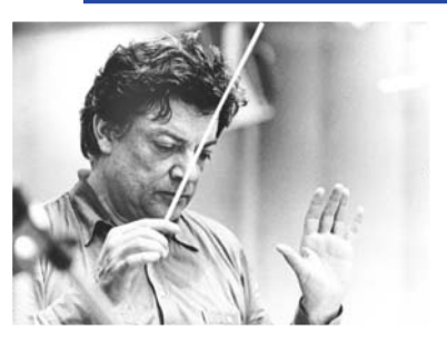
Prime del "Requiem" e del "Concerto per pianoforte e orchestra", importanti opere giovanili recentemente scoperte

promuoverne l'esecuzione oltre Atlantico. Nel precario frangente immediatamente postbellico Thomson non riesce tuttavia a radunare forze sufficienti; in compenso la partitura, di cui l'Autore avrebbe perso nel frattempo le tracce, resta sepolta nell'archivio privato di uno dei musicisti contattati da Thomson, e di lì nella Biblioteca del Purchase College della State University di New York. Questo testimone unico, copia cianografica della partitura manoscritta, sarà a breve disponibile nell'edizione critica curata da Veniero Rizzardi, con l'integrazione di una lacuna circoscritta affidata a Giorgio Colombo Taccani. Nei ricordi di Luigi Nono, per Maderna il Requiem «doveva essere come una corona di fiori che scorreva sul fiume; l'idea gli era venuta leggendo l' Amleto di Shakespeare nel punto in cui Ofelia sparisce lentamente nel fiume». Opera dall'ispirazione intima e tuttavia calata in un impianto monumentale, non è immemore del Requiem verdiano né probabilmente dell'allora recente Missa pro mortuis dedicata dal maestro Gian Francesco Malipiero alla memoria di Gabriele d'Annunzio, anch'essa edita dalle ESZ. Al riferimento estetico e linguistico immediato di Malipiero andrà affiancato quello di