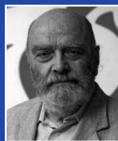
Ricco carnet di appuntamenti in vista dell'80° anniversario e due Cd cameristici