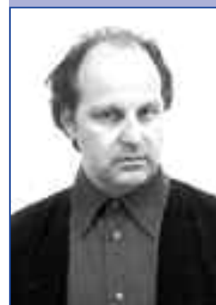
Concerto monografico a Parigi e nuove commissioni