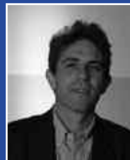
Nuova versione del ciclo portoghese, doppio lavoro ispirato a Silesio e due concerti monografici