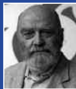
Concerti, volumi e Cd monografici: la Spagna celebra in grande stile l'80° compleanno